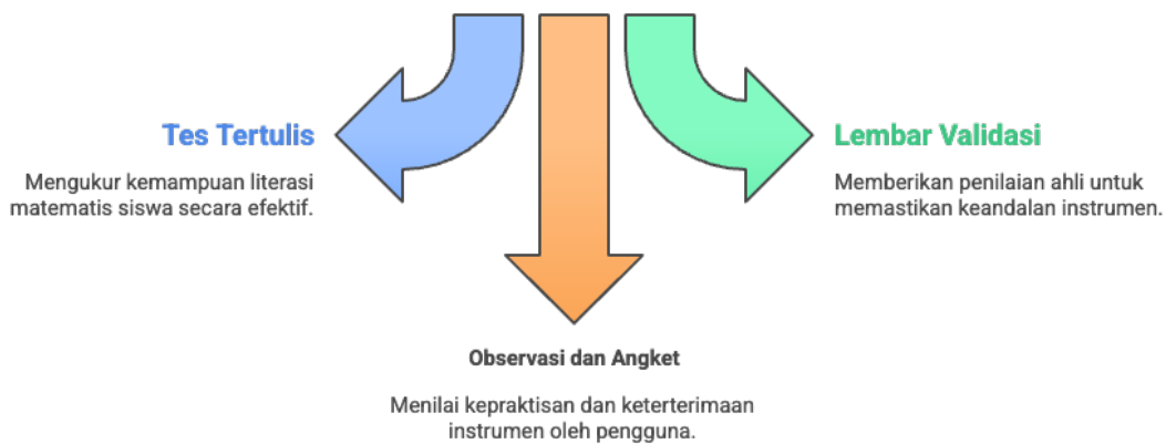
Gambar 2. Instrumen dan teknik pengumpulan data

Pertama, tes tertulis digunakan untuk mengukur kemampuan literasi matematis siswa setelah diberikan instrumen yang dikembangkan. Tes ini dirancang untuk menggali kemampuan siswa dalam memahami, menalar, dan memecahkan masalah matematis yang dikontekstualisasikan dengan kearifan lokal. Kedua, digunakan lembar validasi yang diisi oleh para ahli, meliputi ahli materi matematika, ahli evaluasi pendidikan, dan ahli budaya lokal. Lembar ini berfungsi untuk memperoleh penilaian dan masukan terkait aspek isi, konstruk, bahasa, serta relevansi konteks lokal yang diintegrasikan dalam instrumen. Ketiga, dilakukan observasi dan penyebaran angket kepada guru dan siswa guna mengetahui tingkat kepraktisan serta keterterimaan instrumen yang dikembangkan. Observasi difokuskan pada kemudahan penggunaan dan keterpahaman siswa terhadap konteks soal, sedangkan angket digunakan untuk mengidentifikasi tanggapan dan persepsi pengguna terhadap instrumen yang telah diuji cobakan.